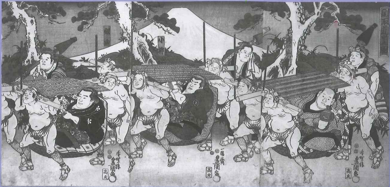
「開取道中之団」 三代豊国 画