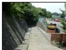
城郷高校の上り坂