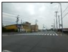
保土ヶ谷区との区境