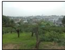
片倉から新横浜の眺