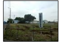
オリマツグループ光陽容器