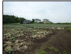
「横浜キャベツ」が広がる