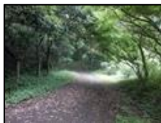
神奈川区とは思えない森林浴