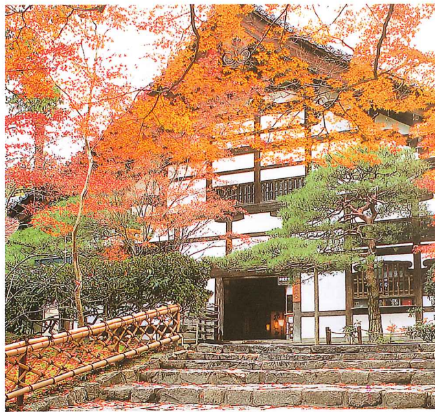
Kuri, main building of the temple