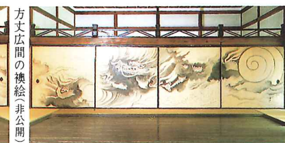
方丈広間の襖絵 (非公開)