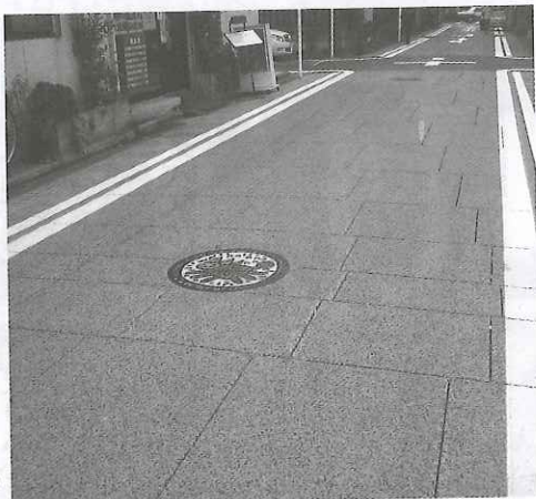
御影石風ベアコートで完成した野毛仲通り商店街

な事故にも繋がります。ちよつとした補修でも、お気軽にお声掛けください。支店・営業所併せて県内15の拠点で迅速に対応いたします。