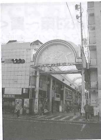
横浜橋通商店街（協）