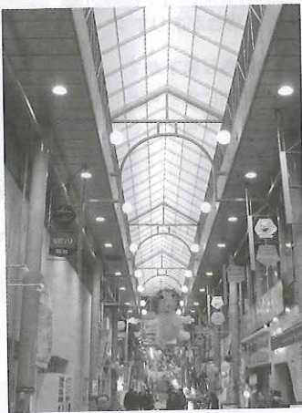
衣笠仲通り商店街（協）

アーケード照明のLED化によって、消費電力及び使用電力料金のコスト削減化が実現できます。横須賀衣笠仲通り商店街（協）など各地で実施しております。