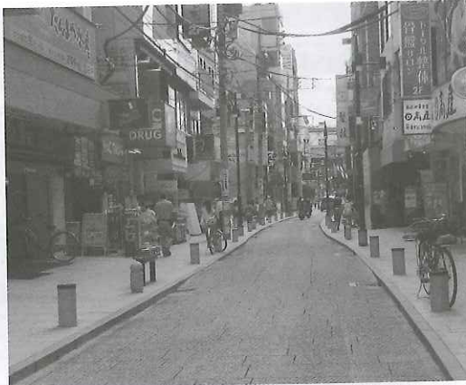
石川商店街（協）では新舗装に加え、歩道の拡張や電線地中化等を行った

◎どんな業務を行っている会社ですか？ 当社は、道路の舗装を中心に、建物周りの外構、駐車場などの工事を行う会社です。ご用命の際には、お客様の予算、ニーズに合わせた舗装材をご提案します。コンピュータグラフィックを用いた完成イメージ、設計図面などをまとめ分かり易くご提案いたします。