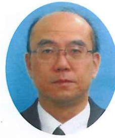
神奈川安全運転管理者会会長