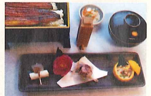
会食用うなぎ料理の一例です。

*会食用おもてなし御膳もご予算に応じて用意いたします。(10名〜。平日限定。要予約)