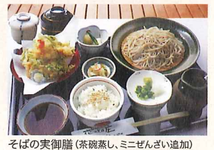
そばの実御膳(茶碗蒸し、ミニぜんざい追加)

せいろ…………… 920 円 天せいろ…………… 1,230 円 そばの実御膳…………… 1,380 円 *そばをうどんにすることもできます。