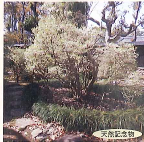
天然記念物 ドウダンツツジ。春には白い花が可憐。