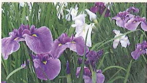
枯山水の庭と調和した花菖蒲は、初夏が 見ごろです。珍しい黄菖蒲も咲きます。