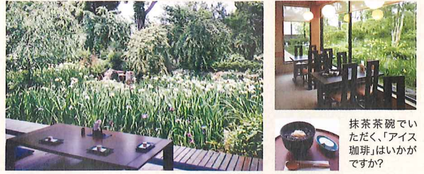
抹茶茶碗でいただく、「アイス珈琲」はいかがですか?

菖蒲や枯山水の見える静かなつくりろぎの空間「一貫(いっかん)」で、手打ちそばや遠州名物のうなぎをご賞味ください。趣味のお仲間との食事会や、お祝い、記念日などにもご利用いただけます。お食事の他に、そばの実ぜんざい、白玉あんみつなど自家製和風喫茶メニューも人気。