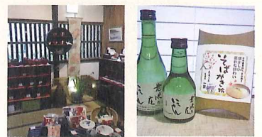
季節ごとに変わる店内

どことなく懐かしさを感じさせる品々を集めました。陶器、雑貨、駄菓子その他、お土産に当館オリジナルの商品もございます。地酒日本酒「いっかん」、手軽に作れる信州北山そば粉「そばがき粉」、おすすめです。