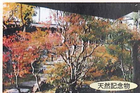
天然記念物 ドウダンツツジは秋の紅葉も見事。庭園が 赤く染まります。紅葉のトンネルも必見!