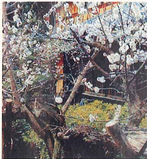
樹齢百数十年の忍辱の梅(にんにくのうめ)

江戸末期に作られた天保庭園の満天星(ドウダンツツジ)の花と紅葉が楽しめます。その他に北側に花菖蒲園、梅園などもあり、庭園が回遊できます。