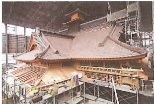
建築途中の奉行所 (平成 20 年 7 月)