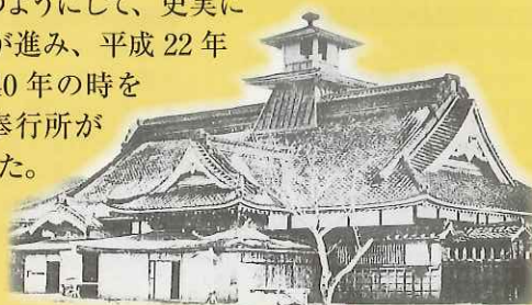
箱館奉行所古写真

函館市では、郭内の建物が失われて五稜郭の本来の姿が理解されにくい状況が続いていたことから、箱館奉行所の復元を主とした五稜郭の史跡整備を計画しました。昭和60年(1985)から発掘調査を始め、古写真や文献資料・古図面などの調査を基に奉行所復元の検討を重ね、平成18年(2006)から工事が開始されました。このようにして、史実に忠実な復元が進み、平成22年(2010)に140年の時を超えて箱館奉行所が再現されました。