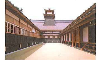
中庭から見上げる太鼓櫓