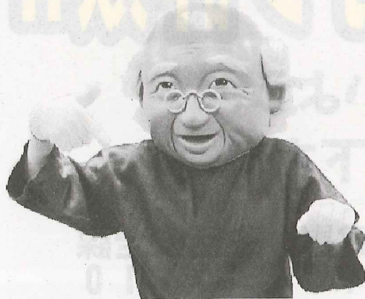
高齢者交通事故防止マスコットキャラクター 高倉 善 (たかくら ぜん)