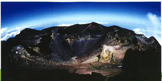
▶ 剣ヶ峰より大内院噴火口を拝す

須走口、吉田口、河口湖口の各登山道を登りつめたところの頂上に鎮座します。この神社は奥宮の末社であり、医薬の神様大名牟遲命、少彦名命をお祀りします。御例祭日は、奥宮と同じ八月十五日です。又、両社では家内安全等の諸祈祷の奉仕、並にお札、お守、縁起物等の授与、金剛杖、行衣等の頂上印(御朱印)を授与しております。