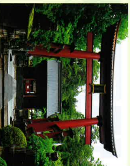
②大鳥居 (日本最大木造鳥居)