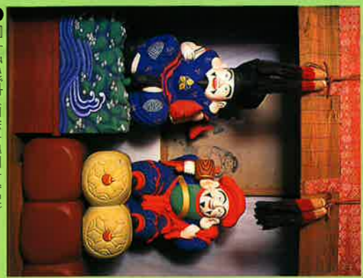
11 富士系びす (国指定重要文化財)