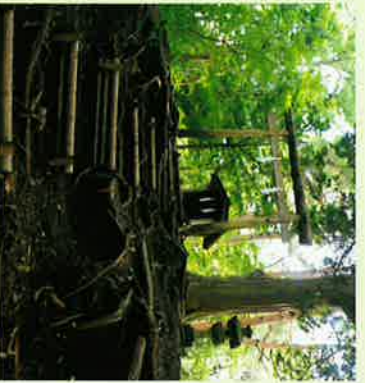
㉓大塚丘 (当社祭祥の地)