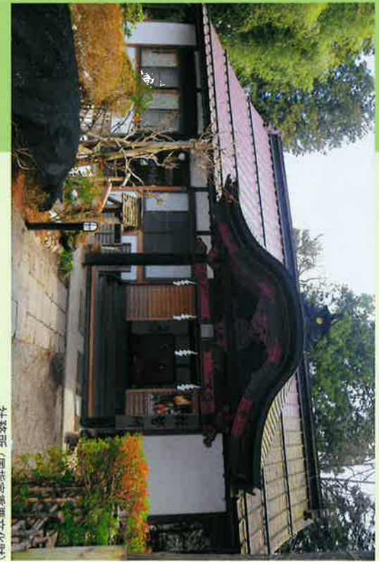
社務所 (国指定重要文化財)