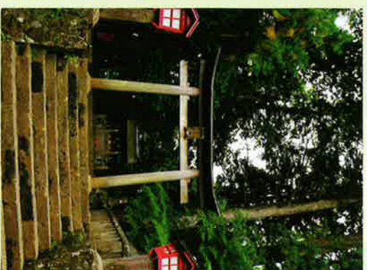
⑱富士登山道吉田口