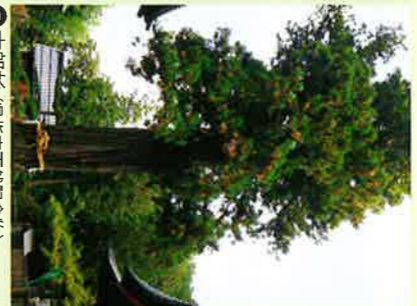
⑦大町杉 (県指定天然記念物)