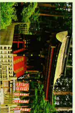
⑬東宮 (国指定重要文化財)