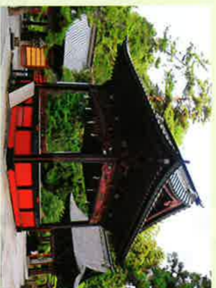
⑤神楽殿 (国指定重要文化財)