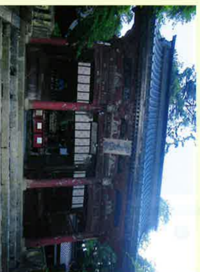
④随神門 (国指定重要文化財)