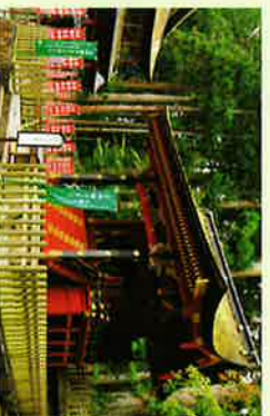
⑮西宮 (国指定重要文化財)