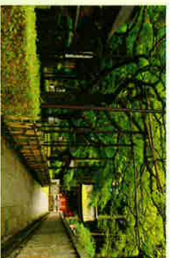
⑫七色もみじ (名木百選選定)