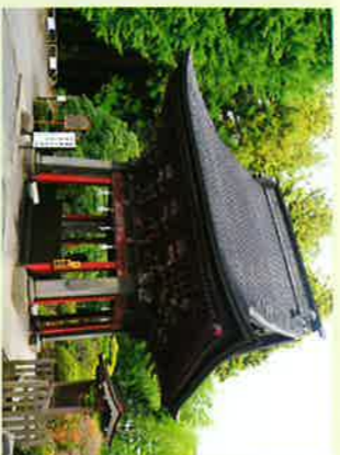
⑥手水舎 (国指定重要文化財)