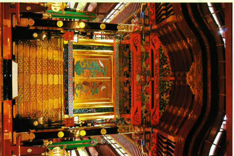
⑩本殿 (国指定重要文化財)