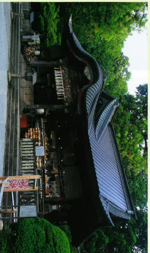
⑨拜殿 (国指定重要文化財)