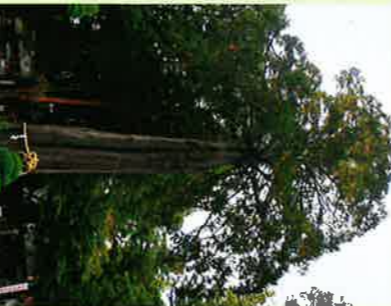
⑧夫婦松 (市指定天然記念物)