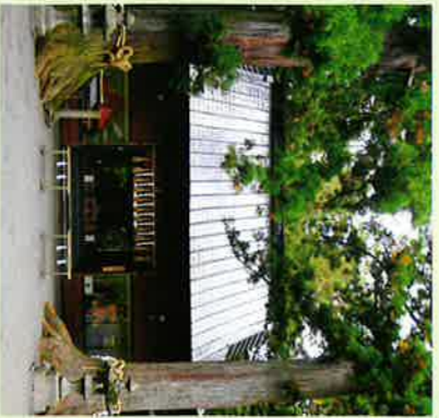
㉒親訪拜殿 (国指定重要文化財)