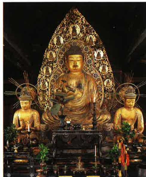
阿弥陀三尊像 (国宝)

〒601-1242 京都市左京区大原来迎院町540 TEL.075-744-2531 FAX.075-744-2480 URL http://www.sanzenin.or.jp