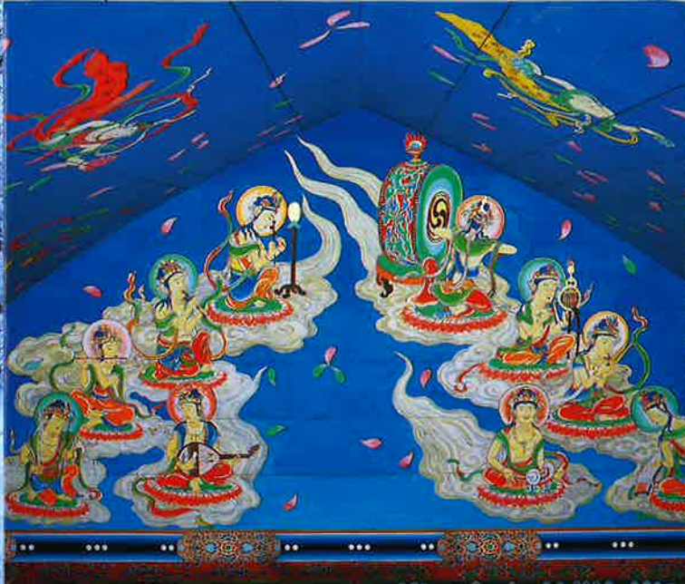
復元模写 往生極楽院舟底型天井画(円融蔵内)