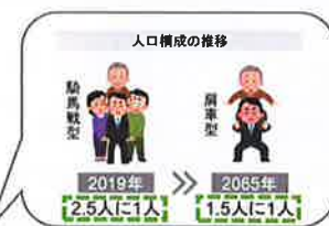
【横浜市の人口構成の推移】

横浜が活気ある都市であり続けるためには、 長期的な視野に立った経済活性化と都市づくり の「ビジョン」が必要