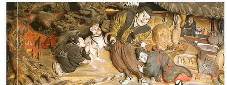
小夜之中山蛇身鳥物語「出発の図」(雲蝶作)