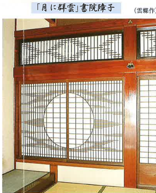
「月に群雲」書院障子