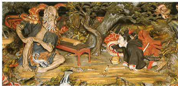
小夜之中山蛇身鳥物語「仙人の図」