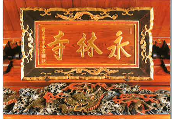
(雲蝶作) 寺号額・龍天護法善神