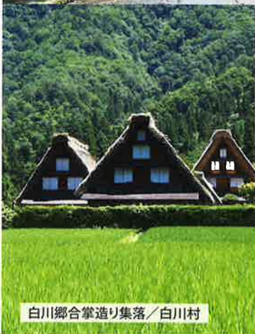
白川郷合掌造り集落 / 白川村