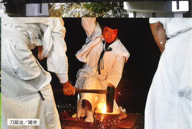
刀鍛冶 / 関市