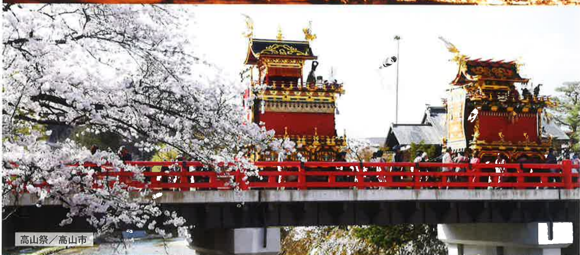
高山祭 / 高山市