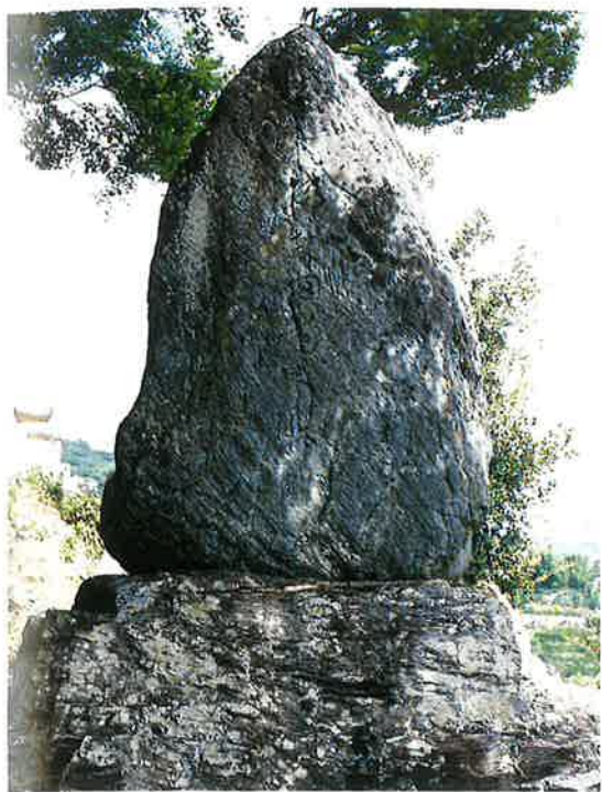
南方熊楠翁の短冊

明治二十八年、山階宮晃親王殿下より「偉哉田道之績」の御染筆を賜わり、明治四十二年、六本樹の丘上の岩屋山の境内に碑を建立する。