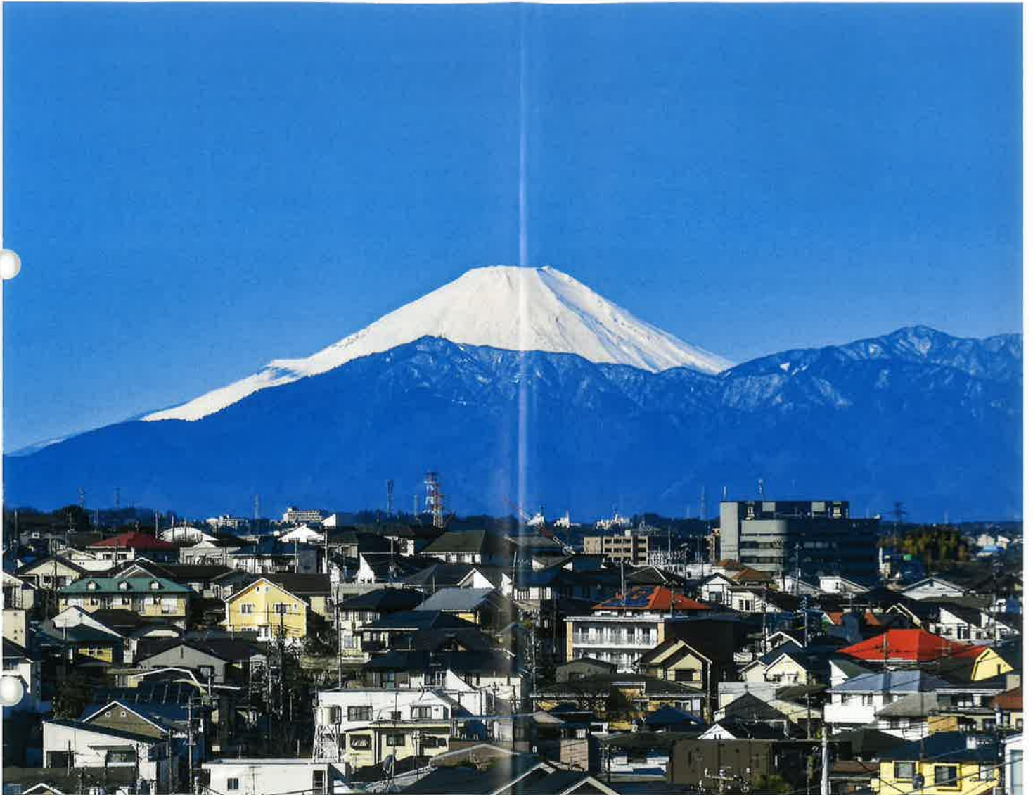
富士山と丹沢連峰

昭和46年11月26日 第三種郵便物認可 毎月1日発行 第792号 令和6年4月1日 東京地方税理士会