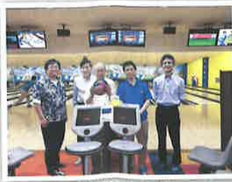
ボウリング同好会