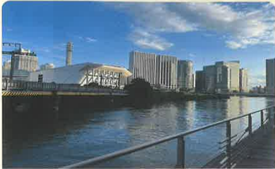
①ポートサイド公園

神奈川区には、月に2回一般開放される横浜中央市場があります。市場に着くまでも楽しめます。 ①対岸にK-アリーナを見ながら歩くポートサイド公園。冬には渡り鳥も。