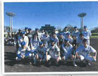
野球・ソフト同好会