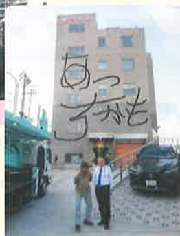
④光岡幸一氏の作品