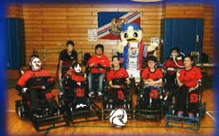
電動車椅子サッカー大会