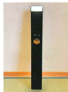
秋田朱輪堂様 線香箱