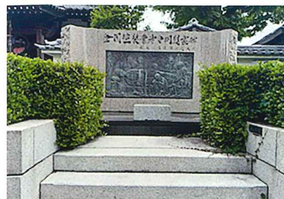
⑧ 全国塗装組合合同慰霊祭