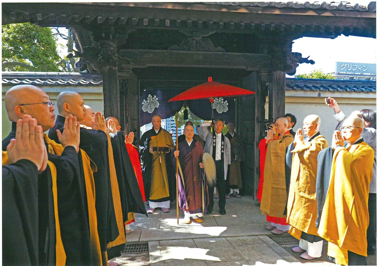
5月10日・晋山式 山門より本堂へ