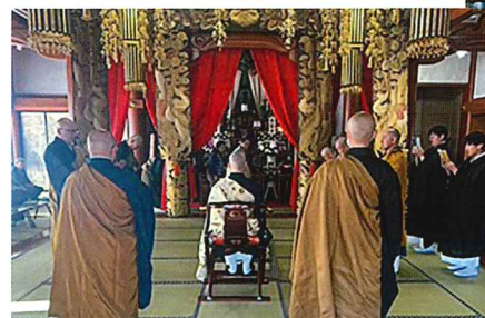
⑤ 春季彼岸会合同供養