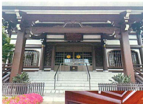
本堂 外壁塗り直し