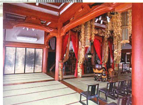
本堂 内壁塗り直し