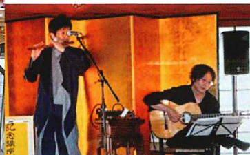
⑥ 釈尊降誕会(花まつり法要)